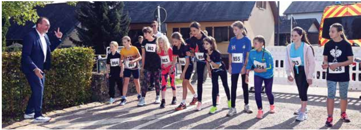
Text: Patrick Muller