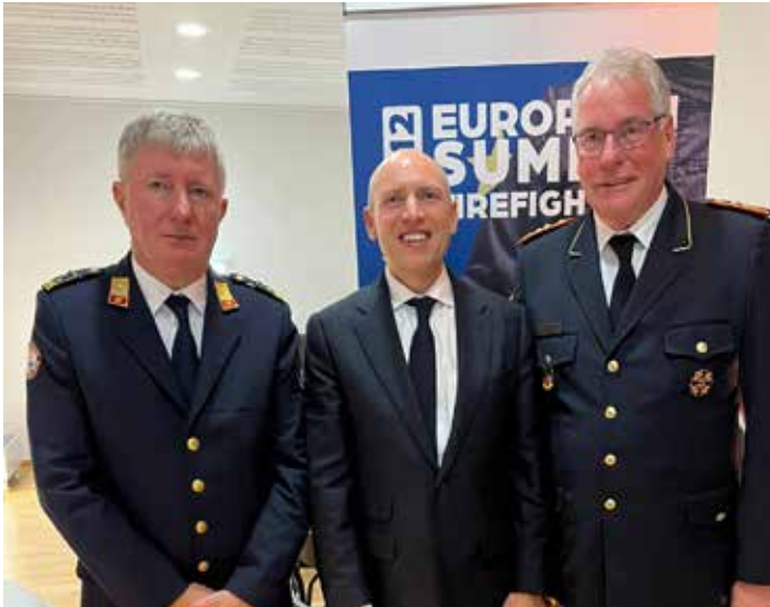
Milan Dubravac (CTIF), Manfred Pentz, Minister für Bundes- und Europaangelegenheiten, Internationale Angelegenheiten des Landes Hessen und Karl-Heinz Banse (DFV)

Vertreter von Feuerwehrverbänden aus Belgien, Bulgarien, Deutschland, Estland, Finnland, Frankreich, Griechenland, Italien, Kroatien, Luxemburg, den Niederlanden, Österreich, Polen, Portugal, Rumänien, Schweden, Slowenien, Spanien, der Tschechischen Republik, Ungarn und Zypern nahmen an dem zweitägigen Treffen am 5. und 6. November in Brüssel teil.